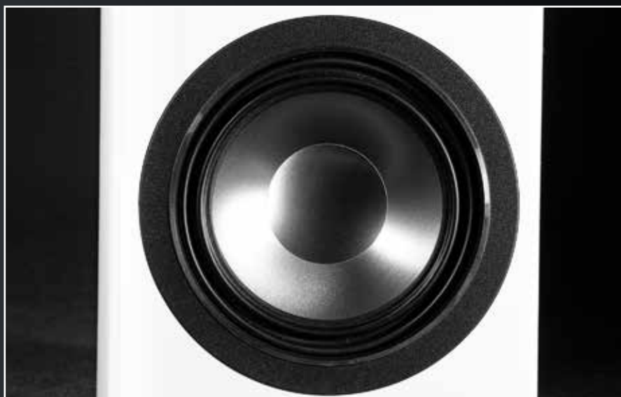
Die markante Wave-Sicken-Technologie von Canton findet sich auch im 154 Millimeter Titanium-Tiefmitteltöner der Vento 826.2 wieder

mittels unsichtbar in das Gehäuse eingelassener Magnete hält, unterstreicht diesen Anspruch ein weiteres Mal. Die Ventos sind keine Lautsprecher, bei dem der Käufer das Gefühl bekommt über den Tisch gezogen worden zu sein. Im Gegenteil. Uns verwundert der gediegene Preis doch sehr. Der Vento 826.2 ist kein Standard-Tischbrühwürfel, sondern kann als ein echter Nahfeldmonitor verstanden werden. Kleine Projektstudios aber auch mittelgroße Hörräume stehen dem Lautsprecher besonders gut. Optional gibt es auch sehr schicke Stative, um