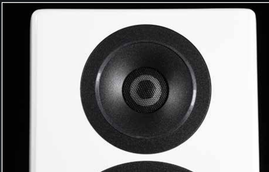
Der Raumzauberer bei Canton ist 25 Millimeter im Durchmesser und besteht aus Keramik. Das Material ist sehr impulstreu, bringt aber auch seine eigene subtile Schärfe mit