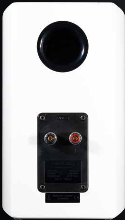
Eine Bassreflexöffnung und Schraubklemmen bzw. Bananensteckerbuchsen. Mehr braucht es nicht

möglich wird. Feine Haucher, die Augen zur Stimme, das Herz des Künstlers, seine Körperhaltung und seinen seelischen Zustand. All diese Eigenschaften meint man mit den Cantons perfekt heraus-hören zu können. Und das beste ist, das funktioniert auch in größeren Setups, nicht nur als Stereo, sondern auch in Surround, wie wir bereits in Ausgabe 2/2019 an Cantons Vento Atmos-Set beweisen konnten. PS: Falls Sie noch einen passenden Verstärker dazu benötigen, können wir Ihnen den Canton Smart Amp 5.1 ans Herz legen. Perfekte Kombi. ■